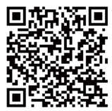
富山地方法務局ホームページQRコード

富山地方法務局 076-441-0550 魚津支局 0765-22-0461 高岡支局 0766-22-2327 砺波支局 0763-32-2361