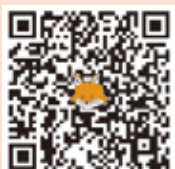
法務省ホームページQRコード

法務省・法務局では、相続登記がされないなどの理由により発生している、所有者不明土地の解消に向けた取組を行っており、令和5年4月から相続土地国庫帰属制度、令和6年4月から相続登記の申請義務化などの各種施策が段階的に実施されます！